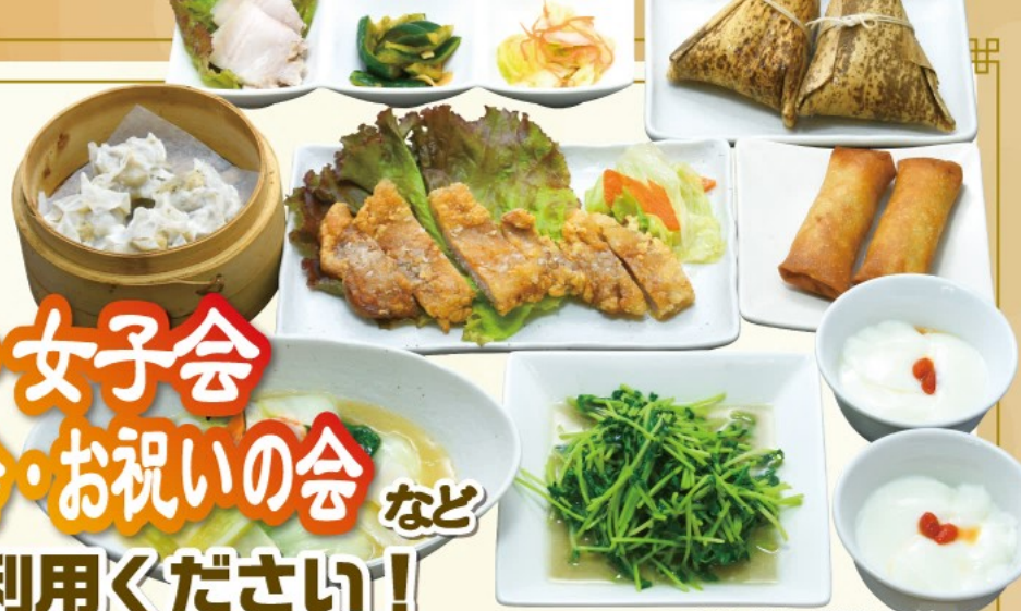
シンプルコース淡水の一例

ご宴会・ご会合・女子会 忘年会・歓送迎会・お祝いの会 など 様々なご用途でご利用ください!